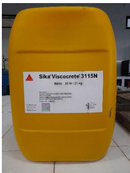
Gambar 1. Superplasticizer

Benda uji beton dibuat menggunakan limbah egg tray sebagai pengganti agregat halus dengan persentase penggantianannya sebesar 3%. Benda uji dibuat dalam 6 variasi penambahan superplasticizer (Gambar 1) yaitu variasi 0% untuk kondisi normal, variasi 0.5%, 1%, 1.5%, 2% dan 5% untuk kondisi penambahan persentase superplasticizer . Setiap variasi dibuat sebanyak 6 benda uji silinder dengan diameter 15 cm dan tinggi 30 cm untuk pengujian kuat tekan pada umur beton 7 hari dan 28 hari